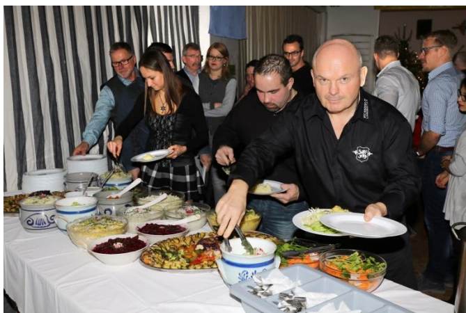
Ein reichhaltiges Buffet